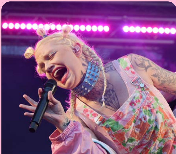
Cazzi Opeia under mellokvällen