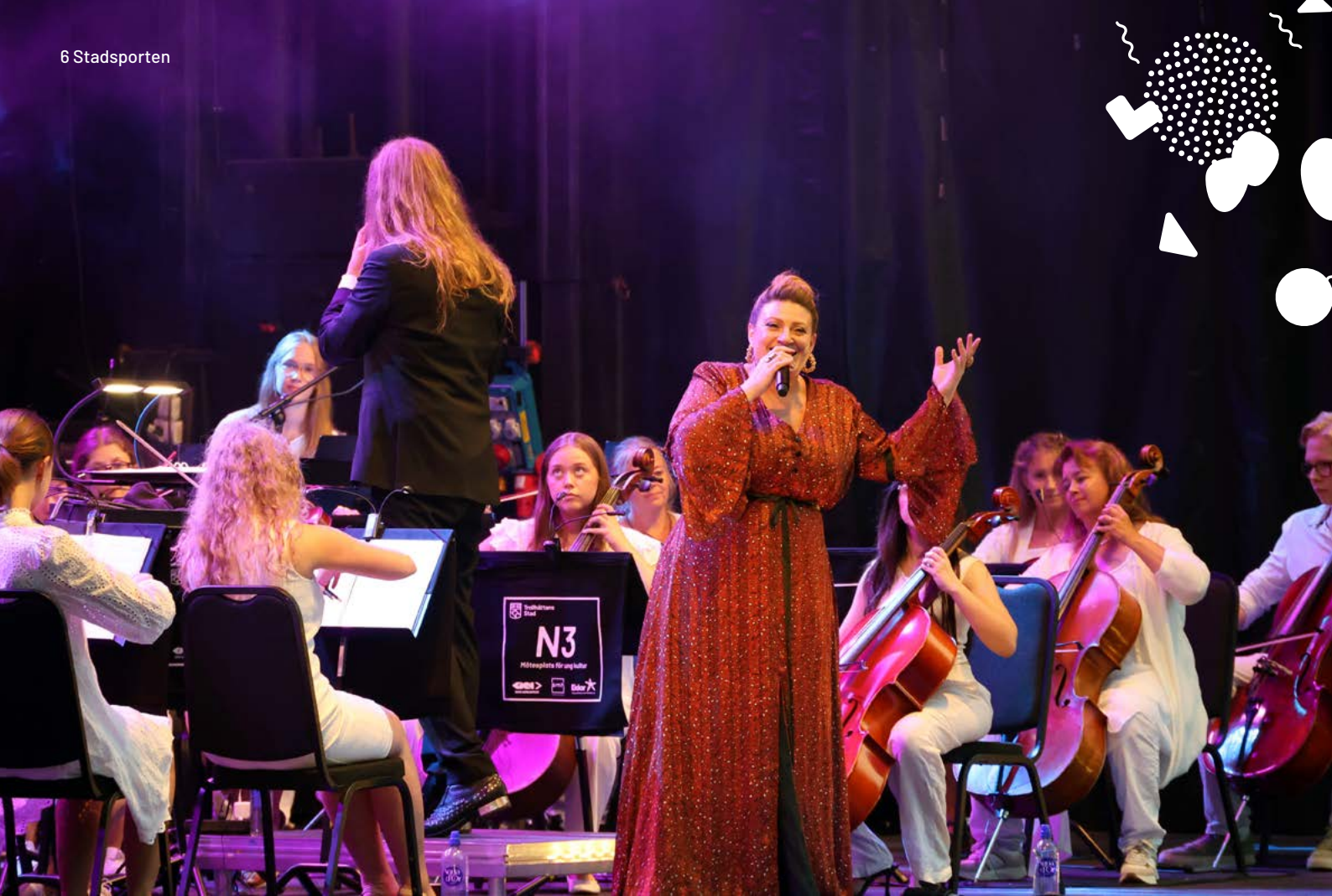
Sarah Dawn Finer på scen med N3 Symfoniorkester.