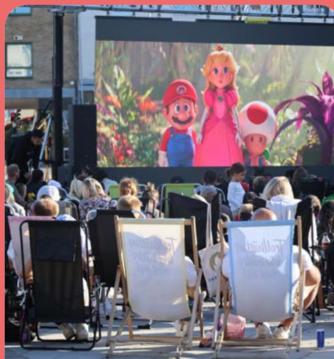
Utomhusbio på torget