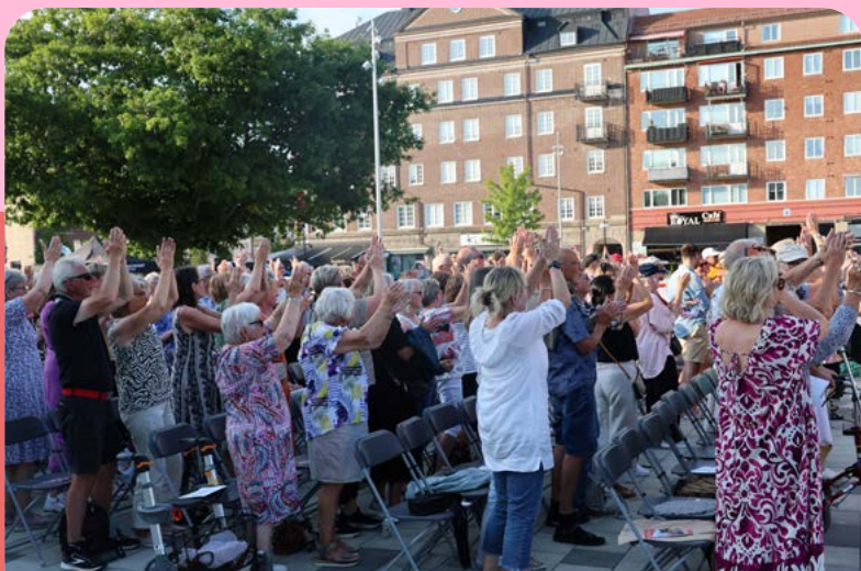
Allsång på torget