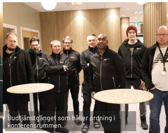
Budtjänstgänget som håller ordning i konferensrummen.