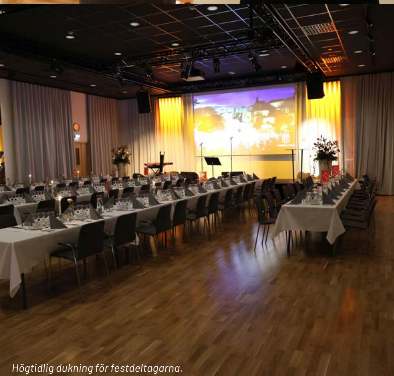
Högtidlig dukning för festdeltagarna.